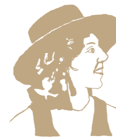
Rosita Alcaraz Spanische Tänzerin