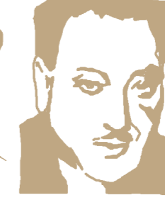
Georges Boulanger Teufelsgeiger