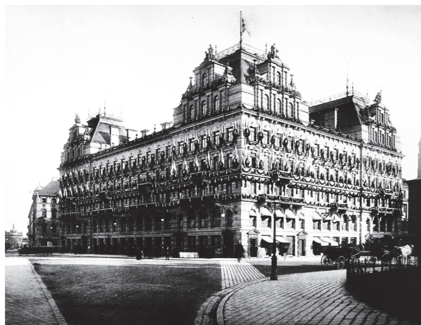
Das Palastcafé im Jahre 1888: Festlich geschmückt zur Centenarfeier von König Ludwig I. präsentiert sich das Café Luitpold mit reichem Fahnschmuck und mit Girlanden.

Wer sich unter dem Café Luitpold der Prinzregentenzeit ein Kaffeehaus vorstellt, mit schnuckeligen Sitzgruppen und netten Plaudernischen, liegt falsch. Im Luitpold – dem berühmte Zeitgeister Attribute wie Feen-Palast oder Kaffeeschloss verliehen – fand das Leben statt. Aus der Vielfalt menschlicher Begegnungen resultierten politische Entwicklung und künstlerische Auseinandersetzung. Hier waren die Freigeister und Vordenker genauso daheim wie Bildungsbürger und Adel. Wirtschaftsbose, wie man heute sagen würde, diskutierten mit Anarchisten, der junge Literat bestaunte den großen Künstler, der Student bewunderte den Liebreiz der Wassermadln. Erlebnenswertes Streiflichter aus dem legendären Kosmos Luit-