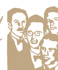
Kreuders Melody Swingers Tanzmusik