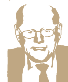
Norry Folk Bar-Pianist