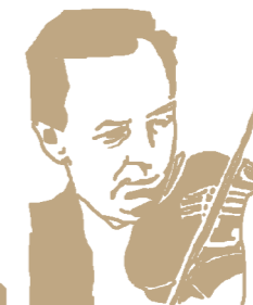
Barnabás von Géczy Geigen-Virtuose